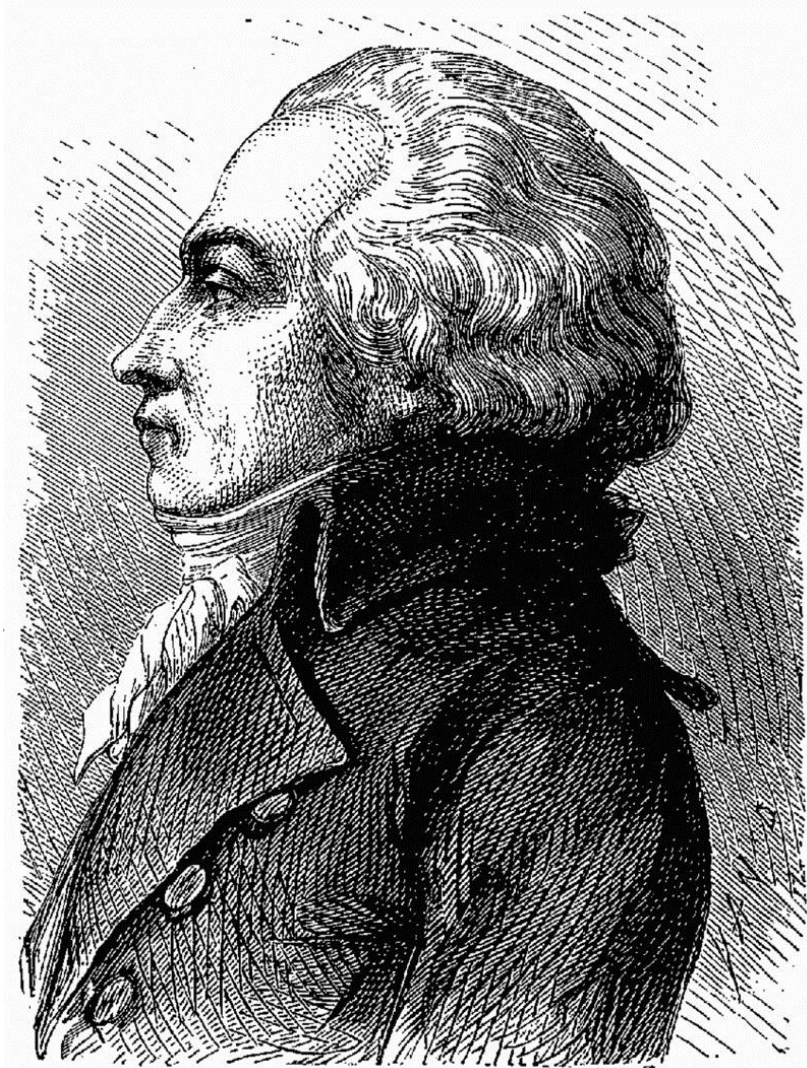
Jacques Constantin PERIER (1742-1818)